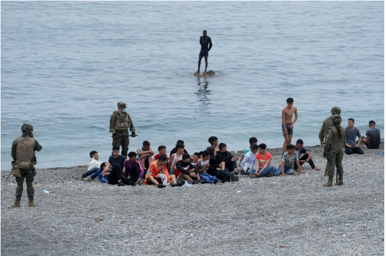
Des migrants marocains sur une plage de Ceuta, en mai 2021.

Cette méthode est beaucoup moins chère : il faut compter entre 2 500 et 12 000 euros pour rejoindre les enclaves [Ceuta et Melilla sont les deux territoires espagnols en Maroc, seules frontières terrestres en Afrique avec l'Europe, ndlr] par voie terrestre, en se cachant dans des camions. Alors qu'à la nage, elles ne doivent déboursier que quelques centaines d'euros pour se payer des bouées, une combinaison et des palmes.