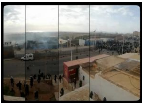
Panorama montrant la cour du Barrio Chino

Ce panorama nous donne une vue claire de la cour, qui est devenue un foyer de violence intense. À l'intérieur du poste frontière, on peut voir les casques blancs de la police, qui a suivi les migrants dans la zone. Les rencontres sont violentes.