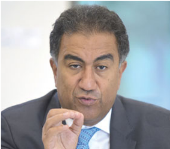
Fathallah Sijilmassi

Le Maroc a comme objectif d'apporter une nouvelle vision des réalités et des différents paramètres autour d'un sujet de plus en plus prioritaire dans l'agenda international. Au-delà de l'échange que cette rencontre a permis, le workshop a pu dégager des pistes de réflexion sur les possibilités de reconstruire autrement les rapports de co-développement entre les deux rives de la Méditerranée. Orienté autour de quatre thématiques principales, portant sur des causes profondes de la migration, la question du genre et la migration, les migrants et les marchés de l'emploi et enfin le nécessaire approfondissement du dialogue culturel, le workshop a analysé le sujet de différents angles menant vers de nouvelles recommandations stratégiques et opérationnelles. «La problématique de la migration, de la mobilité et du développement est aujourd'hui centrale dans l'agenda international», affirme Fathallah Sijilmassi, initiateur du workshop. L'ancien secrétaire général de l'Union pour la Méditerranée (UpM) mesure bien l'importance et les contours de ce sujet au Maroc et au-delà. «Nous avons toutes les bonnes raisons de nous réunir autour de cette thématique et de réfléchir ensemble sur ce sujet, d'en examiner ses particularités, et de contribuer à la réflexion et surtout