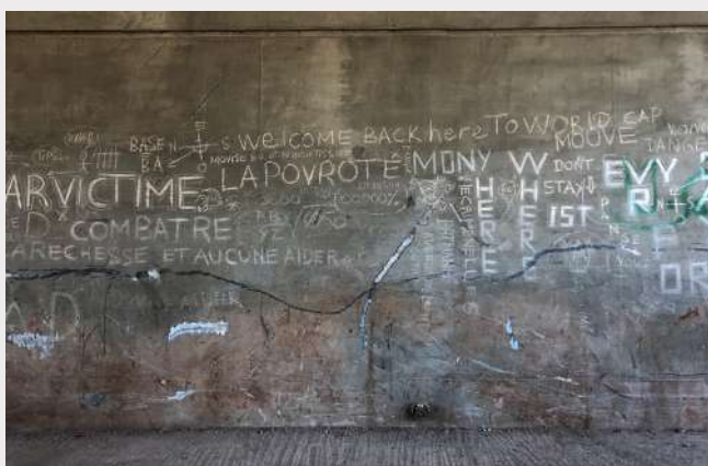
Mission de terrain près de la gare routière Oulad Ziane

Une partie de sa mission a porté sur les questions de mineur·e·s marocain·e·s isolé·e·s afin de comprendre les processus d'expulsion depuis l'Europe (particulièrement France et Espagne) et le devenir de ces jeunes une fois de retour au Maroc.